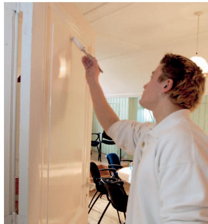
De leerling die sinds een paar maanden in dienst is, bevalt goed. Mogelijk is dit de eerste werknemer van deze ondernemer zonder personeel