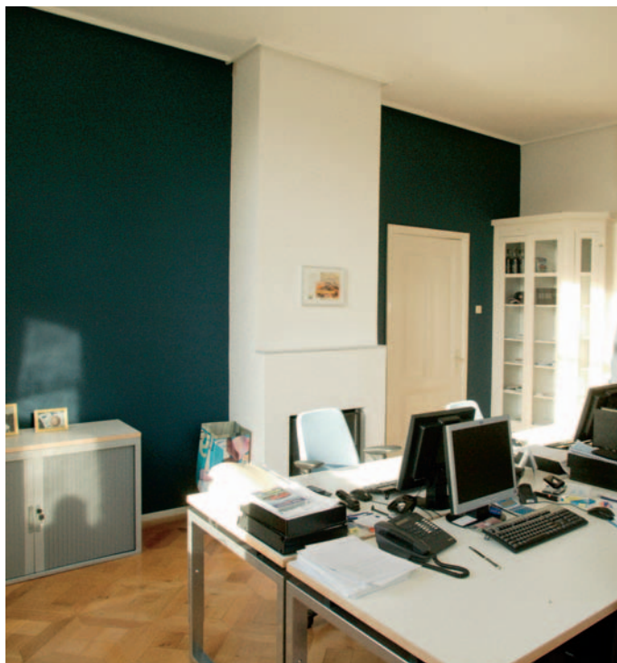
Met de keuze van een paar heel bijzondere kleuren kreeg de opknopbeurt van dit pand nu net dat beetje extra

zig aan het binnenschilderwerk. Een hele klus, alleen al de grote hoeveelheden ornamenten en armdikke deuren en raamkozijnen in aanmerking nemend. De kleuren in het pand zijn gedekt, maar toch heeft Oude Heuvel op elke verdieping en in sommige ruimten iets bijzonders weten te doen, zoals een aardachtig soort grijs in de hal, of een diepblauw in een van de werkkamers beneden, afkomstig van de Klassieke Kleurenwaaier van Remmers, contrasterend met een helderrood in de kamer ernaast. Werkelijk heel subtiel is zijn kleurgebruik op het plafond in de hal. Daar heeft hij het wit van het plafond zelf net iets donkerder genomen dan het wit van de ornamenten, zodat die laatste net iets mooier tot hun recht kwamen. 'Zo kun je de opdrachtgever toch iets extra's bieden,' aldus Oude Heuvel. 'Dat is, denk ik, één van de principes van goed ondernemerschap, dat je de mensen biedt wat ze willen. Op dit project kon het niet uit om de ondergrond volledig uit te plamuren, waardoor niet al het schilderwerk er even strak uit ziet als zou kunnen. Een goede ondernemer maakt zijn klanten duidelijk wat de mogelijkheden zijn, en laat aan hen de keuze welk niveau van afwerking gewenst is. Maar dan is het leuk dat je met dit soort kleuraccenten ook echt iets extra's kunt brengen.'